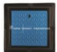
دریچه آتش نشانی سایز 40 در 40