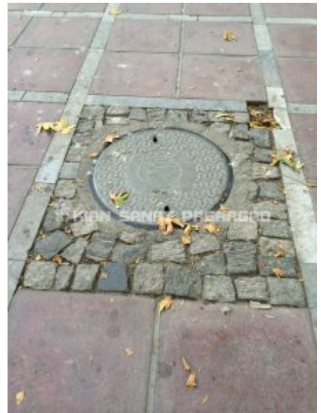
دریچه منهول گیان صنعت پاسارگاد