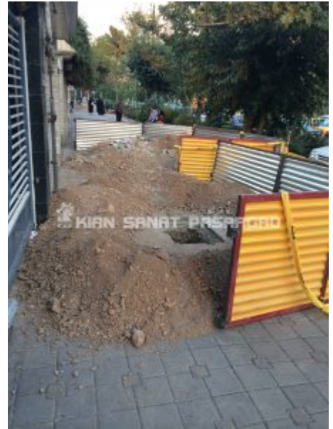
دریچه منهول پلی اتیلن