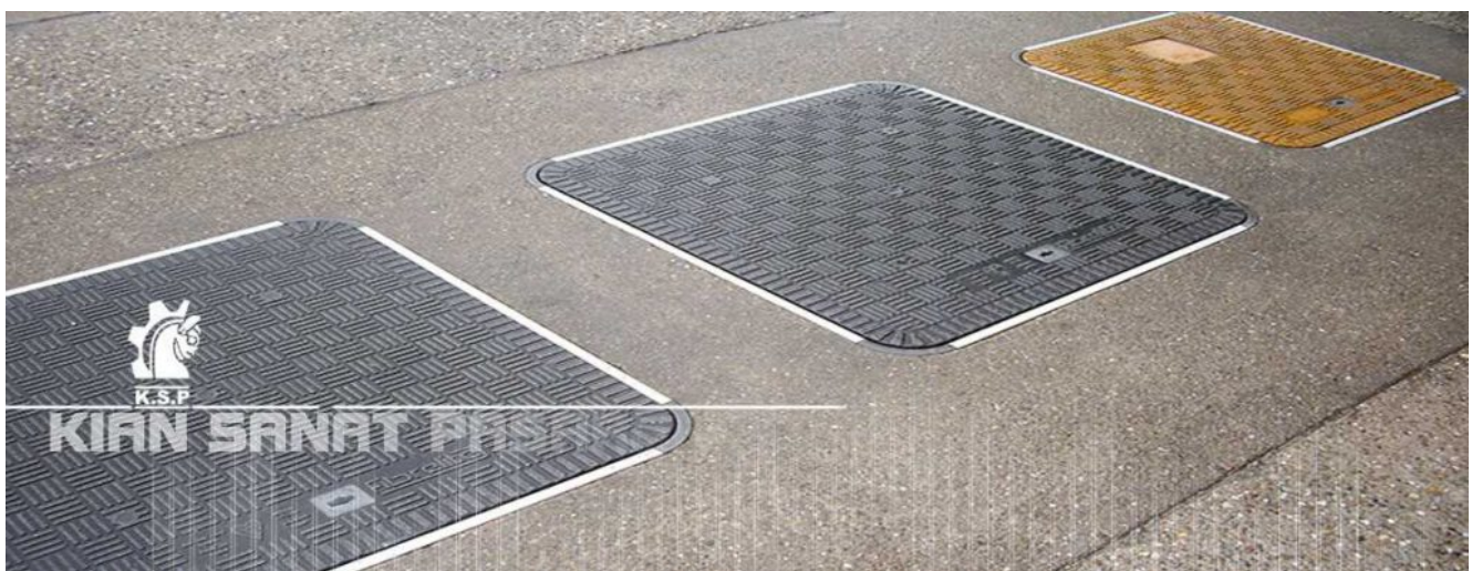
دریچه منهول پلی اتیلن

دریچه های منهول پلی اتیلن طبق استاندارد BS-124 تولید و طبق کلاس های مندرج در جدول تست میگردند. A15, B125, C250, D400 : کلاس میزان تحمل فشار(تن) : 1.5, 12.5, 25, 40