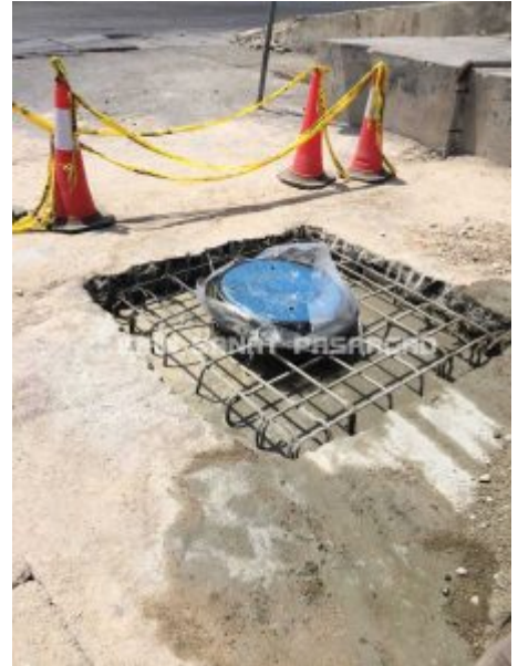
دریچه منهول پلی اتیلن